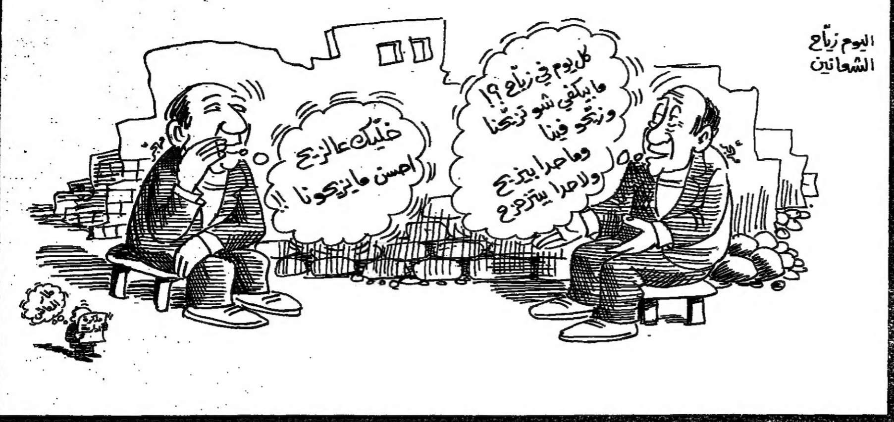
اليوم زيارت الشحاتين